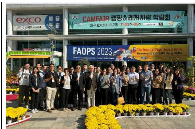
台灣與會者大合照