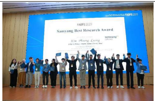
Young Investigator Award