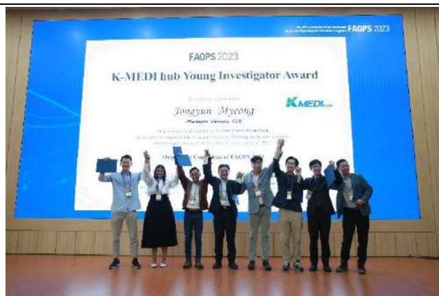
Samyang Best Research Award