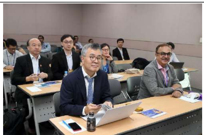
大會 GA meeting 台灣代表