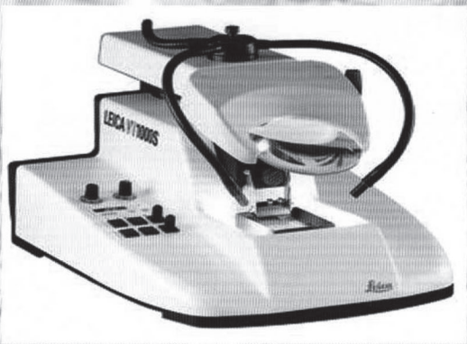
Leica VT1000 S